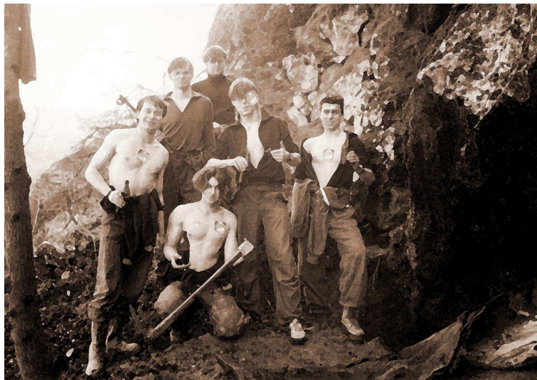
ЎПРАВДА: КУБА 2014 & МАДУК 2017